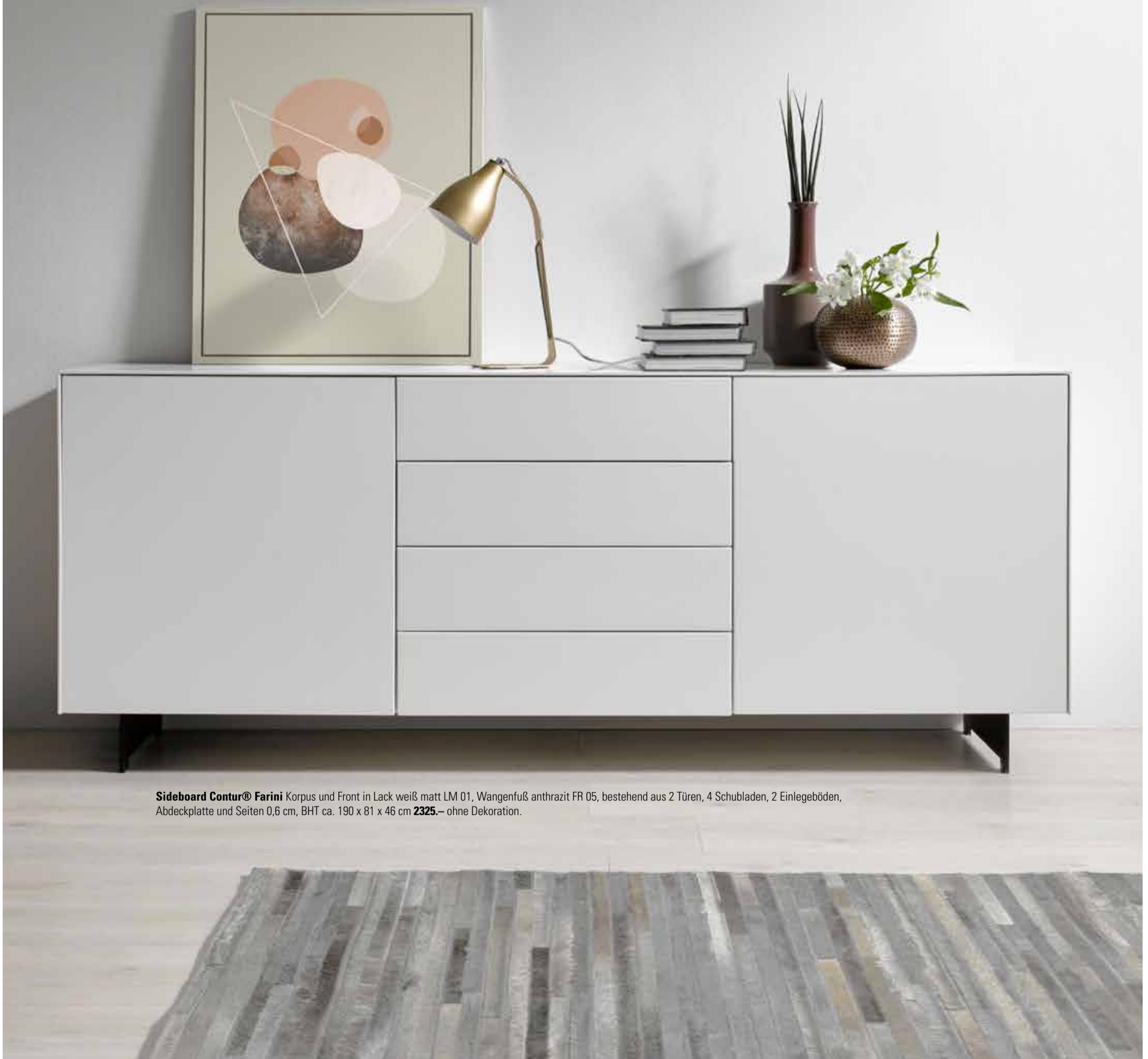
Sideboard Contur® Farini Korpus und Front in Lack weiß matt LM 01, Wangenfuß anthrazit FR 05, bestehend aus 2 Türen, 4 Schubladen, 2 Einlegeböden, Abdeckplatte und Seiten 0,6 cm, BHT ca. 190 x 81 x 46 cm 2325.- ohne Dekoration.