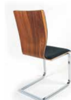
Milos-20 : Sicheholzschale raum furniert, Sitz und in Echt-Leder, ab 419.-