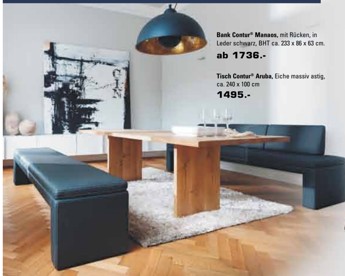
Bank Contur® Manaos , mit Rücken, in Leder schwarz, BHT ca. 233 x 86 x 63 cm. ab 1736.-