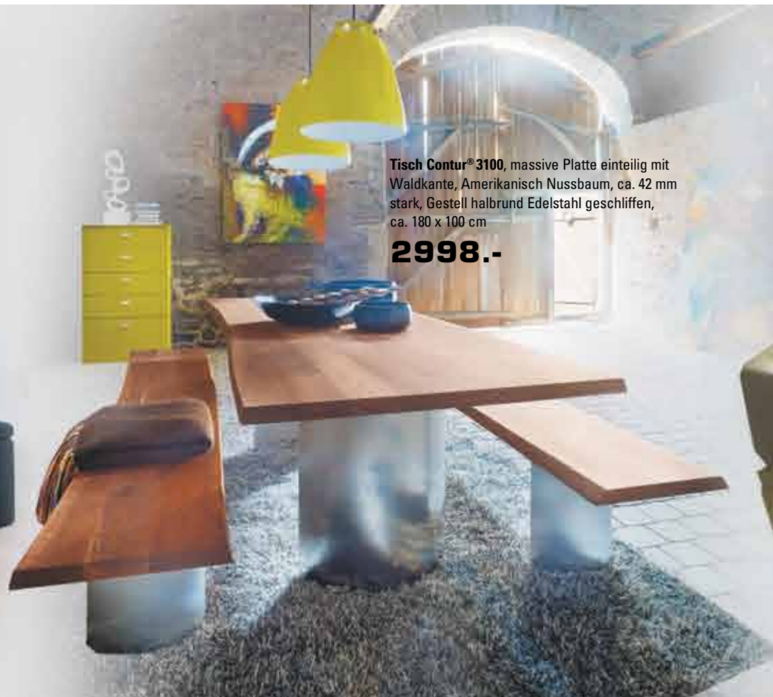
Tisch Contur® 3100 , massive Platte einteilig mit Waldkante, Amerikanisch Nussbaum, ca. 42 mm stark, Gestell halbrund Edelstahl geschliffen, ca. 180 x 100 cm 2998.-