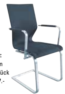
Contur® Milos-20 : Sitz und Rücken in Formstrick, am Stück gearbeitet, ab 517.-