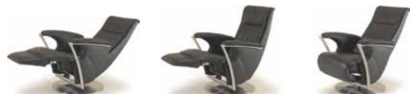
Contur® Girona Moleno medium in Leder, manuelle Verstellung ab 2285.-