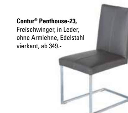
Contur® Penthouse-23 , Freischwinger, in Leder, ohne Armlehne, Edelstahl vierkant, ab 349.-