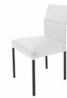
Contur® 4100-20 , Freischwinger, in Leder, ohne Armlehne, ab 399.-