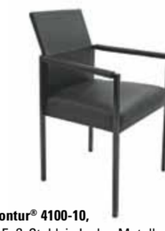
Contur® 4100-10 , 4-Fuß-Stuhl, in Leder, Metallgestell, mit Armlehne, ab 429.-