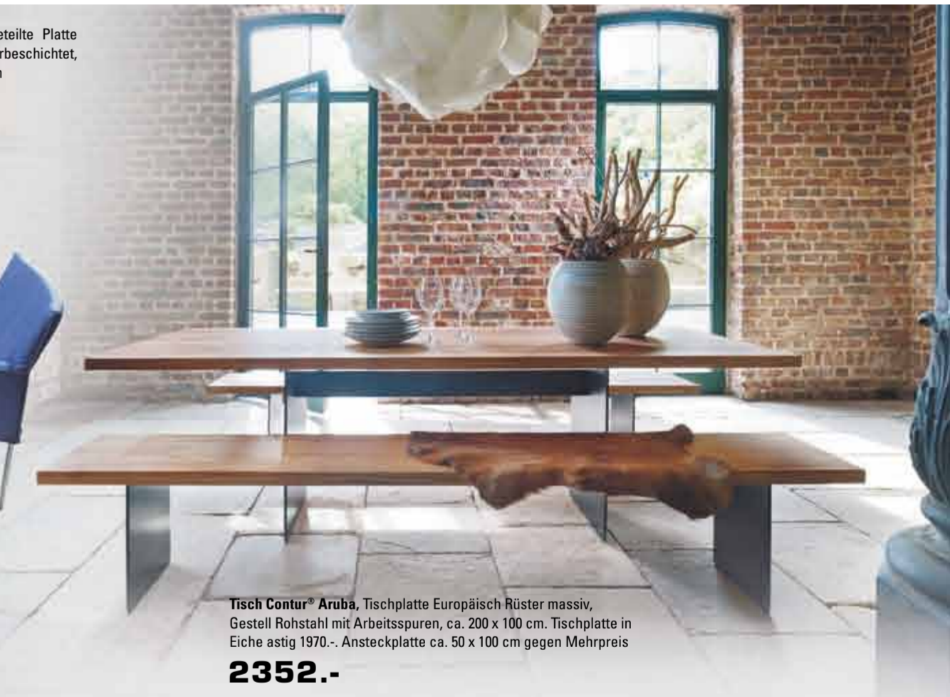
Tisch Contur® Aruba , Tischplatte Europäisch Rüster massiv, Gestell Rohstahl mit Arbeitsspuren, ca. 200 x 100 cm. Tischplatte in Eiche astig 1970-. Ansteckplatte ca. 50 x 100 cm gegen Mehrpreis 2352.-