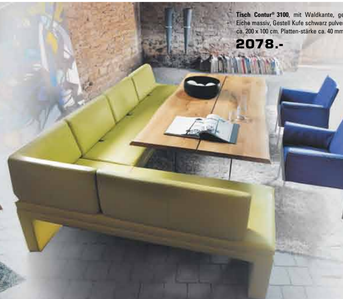
Tisch Contur® 3100 , mit Waldkante, geteilte Platte Eiche massiv, Gestell Kufe schwarz pulverbeschichtet, ca. 200 x 100 cm. Plattenstärke ca. 40 mm 2078.-