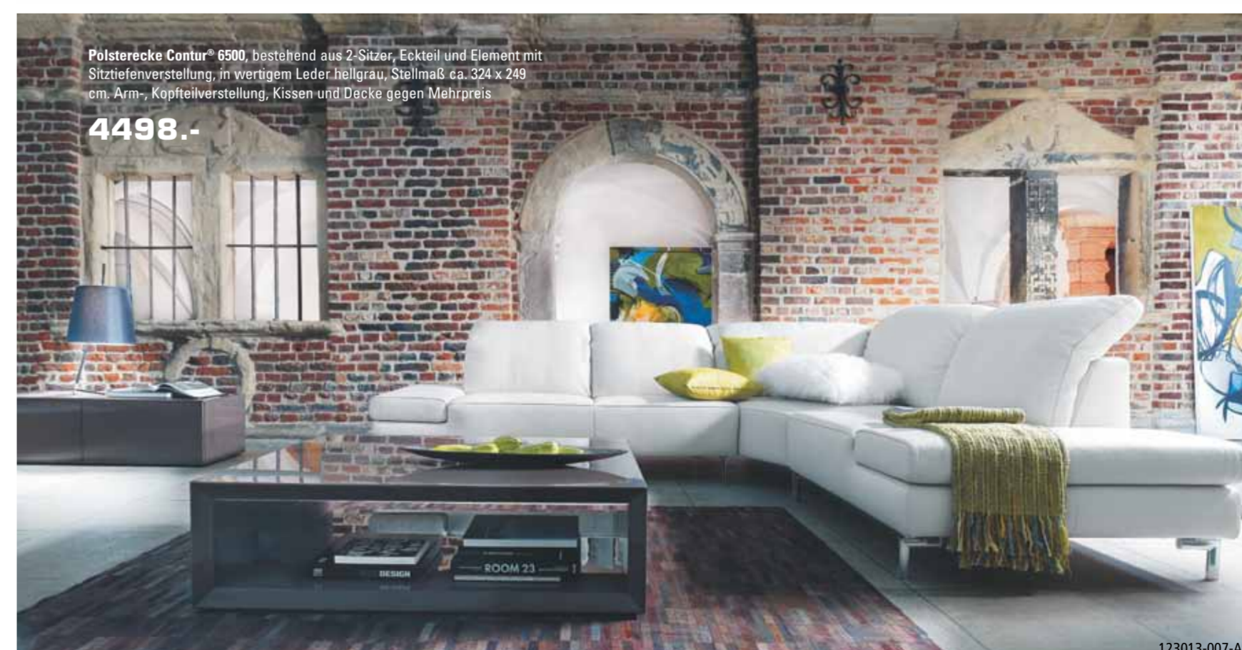
Polsterecke Contur® 6500, bestehend aus 2-Sitzer, Eckteil und Element mit Sitztiefeverstellung, in wertigem Leder hellgrau, Stellmaß ca. 324 x 249 cm, Arm-, Kopfteilverstellung, Kissen und Decke gegen Mehrpreis