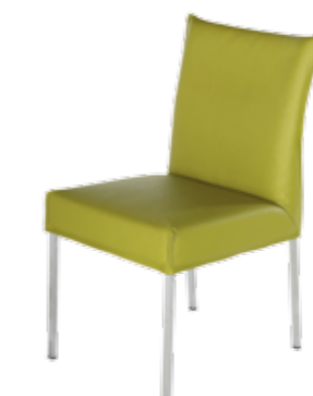
Contur® Penthouse-41 , 4-Fuß-Stuhl, in Leder, ohne Armlehne, Edelstahl vierkant, ab 399.-. Preisgleich auch in Rundrohr erhältlich