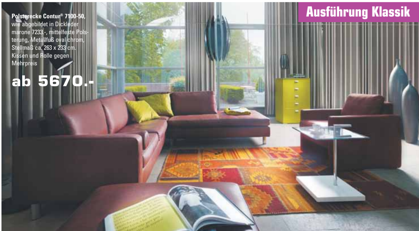
Polsterecke Contur® 7100-50, wie abgebildet in Dickleder marone 7233 -, mittelfeste Polsterung, Metallfuß oval chrom, Stellmaß ca. 263 x 233 cm, Kissen und Rolle gegen Mehrpreis