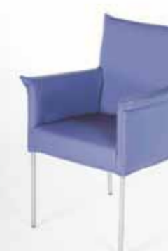
Contur® Penthouse-42 , 4-Fuß-Stuhl in Leder, mit Armlehne, Edelstahl rund, ab 499.-