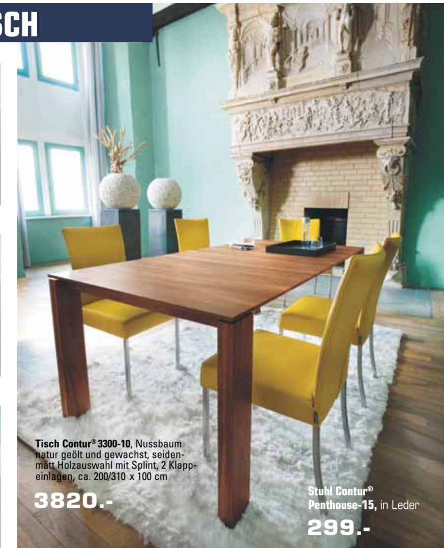
Tisch Contur® 3300-10 , Nussbaum natur geölt und gewachst, seidennäht Holz auswahl mit Splint, 2 Klapp-einlagen, ca. 200/310 x 100 cm