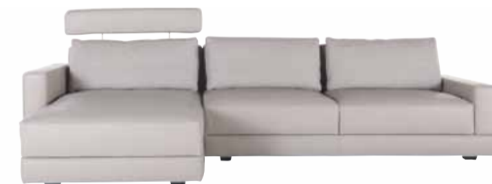
Sofa Contur® 8900, Longchair mit Doppelselement, Kopfstützen, Kissen und Kippfunktion gegen Aufpreis. In Leder ca. 295x73x153 cm.