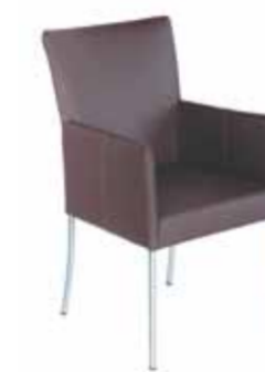
Contur® Penthouse-10 , 4-Fuß-Stuhl in Leder, mit Armlehne, Edelstahl rund, ab 449.-