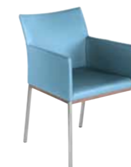
Contur® Penthouse-25 , 4-Fuß-Stuhl, in Leder, mit Armlehne, Edelstahl vierkant mit Holz, ab 429.-