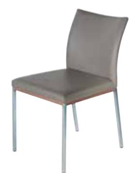
Contur® Penthouse-24 , 4-Fuß-Stuhl, in Leder, ohne Armlehne, Edelstahl vierkant mit Holz, ab 310.-