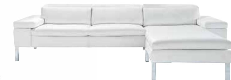
Polsterecke Contur® 6900, 2-Sitzer mit Ottomane, legere Polsterung, Sitzmatte, mit manueller Rückenverstellung, in Leder, ca. 278 x 189 cm