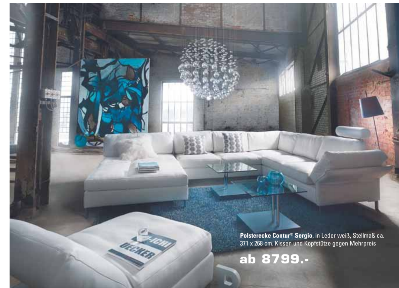
Polsterecke Contur® Sergio, in Leder weiß, Stellmaß ca. 371 x 268 cm, Kissen und Kopfstütze gegen Mehrpreis

Trend im Bereich Leder spürbar und löst nach und nach Schwarz bei Leder-Garnituren immer mehr ab: Weiß. Schon längst kommt an Weiß keiner mehr vorbei. Die Nichtfarbe wird dabei vor allem mit Leichtigkeit und Klarheit assoziiert, geht mit einer optimistischen Lebenseinstellung einher und gilt zudem als zeitlos und hervorragend kombinierbar – mit anderen, kräftigen Farben oder Ton in Ton mit abgedeckten